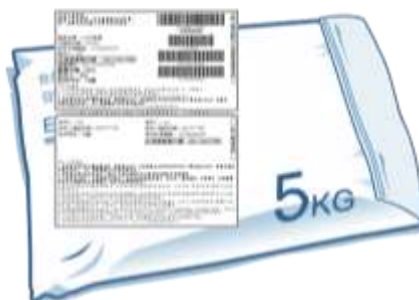
列印交貨便服務單黏貼於商品上 或抄下交貨便代碼