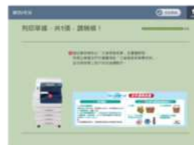
等候列印寄件資料 並至櫃檯辦理