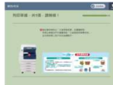
等候列印寄件資料 並至櫃檯辦理