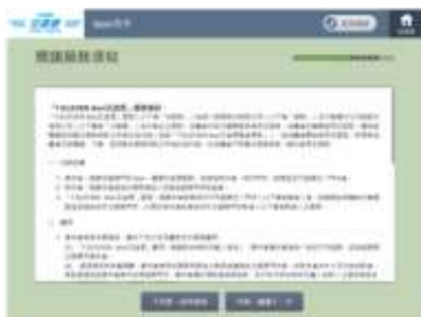
閱讀服務須知並按下同意