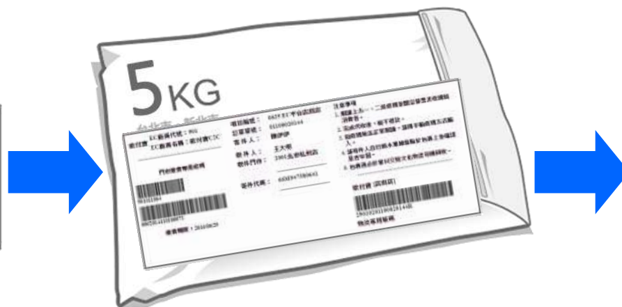
將標籤貼於外包裝