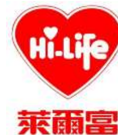
萊爾富櫃檯繳款、寄件